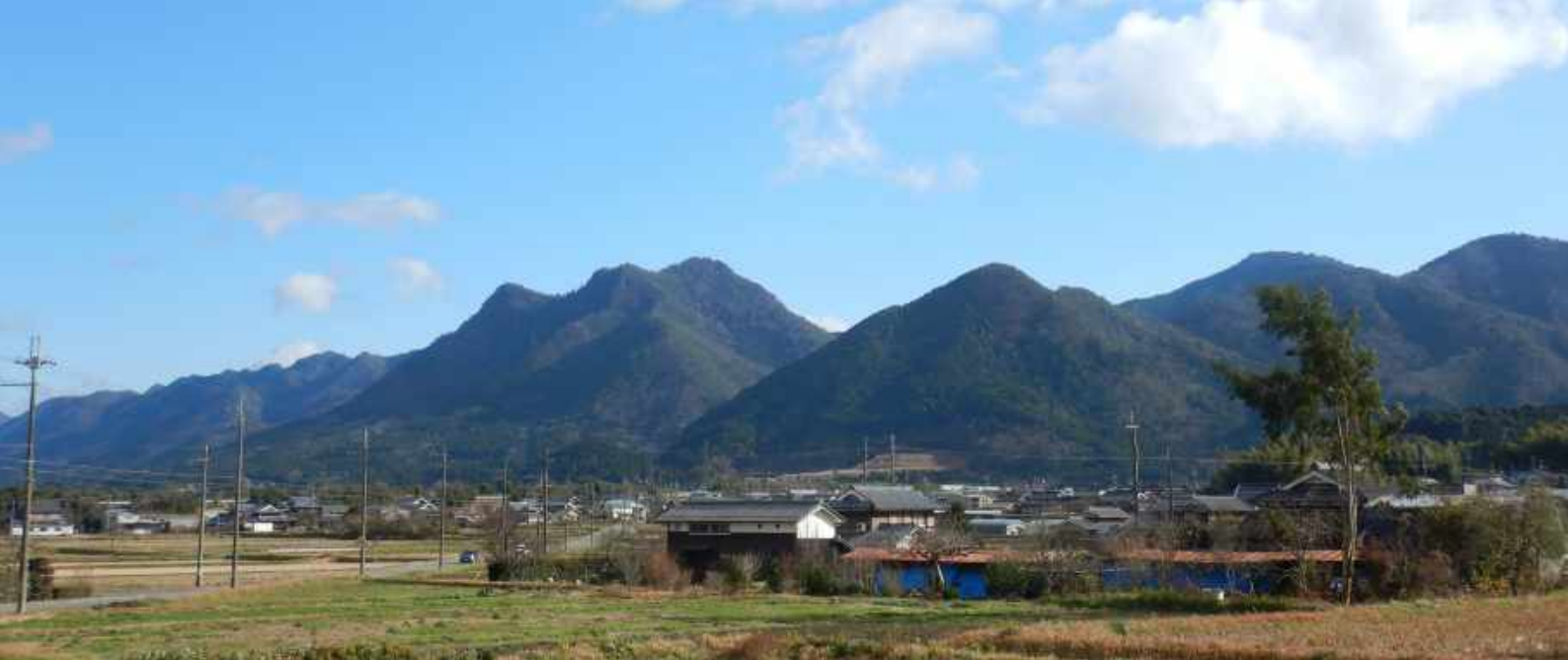
◇ある晴れた日の風景