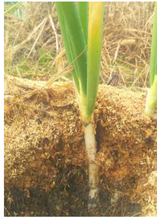
◇根元にもみ殻を積んだネギ