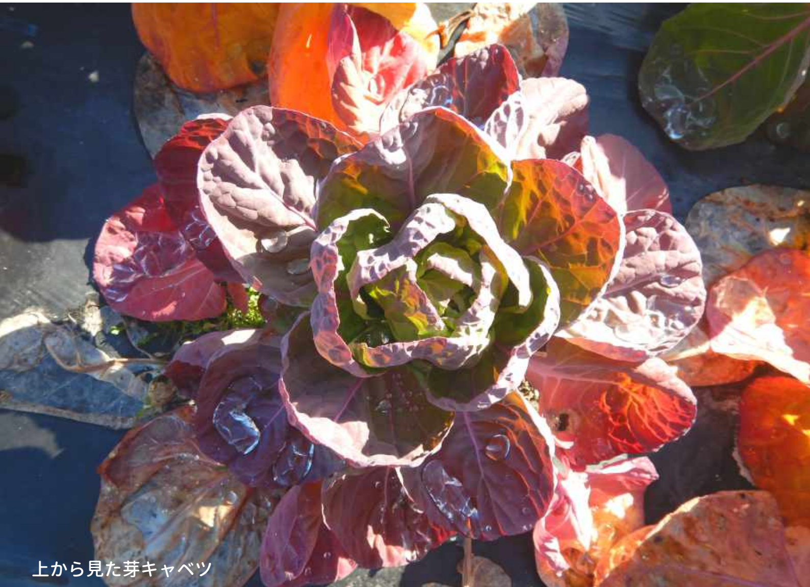
上から見た芽キャベツ