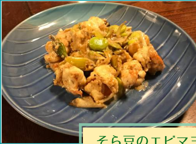
そら豆のエビマヨ